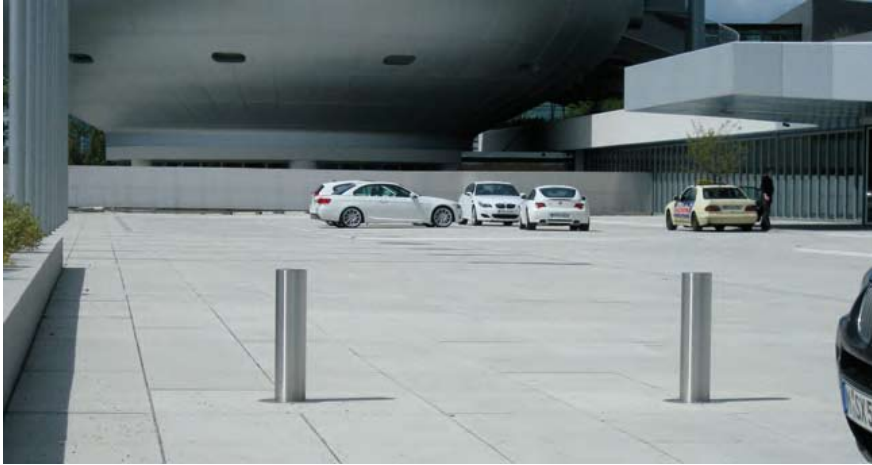
BMW - Group München