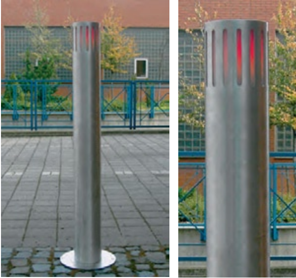
Poller mit integrierter zweiflämiger Beleuchtung in LED-Technik: rot-grün zur Signalisierung der Betriebszustände