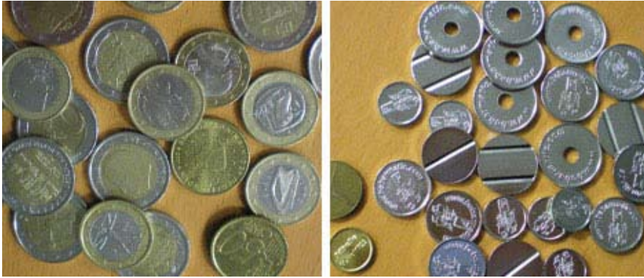
Dieser Münzprüfer verarbeitet bis zu acht verschiedene Euro-Münzen, sowie zwei verschiedene Token.