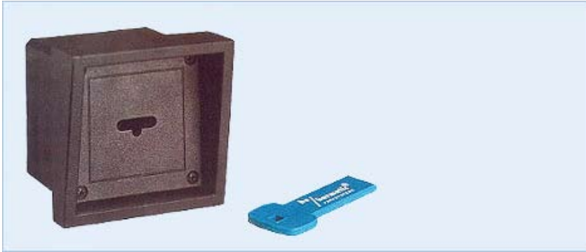
Magnetschlüssel ES-Key für magnetisch codierte Schlüssel, die nicht duplizierbar sind. Das System arbeitet ohne zusätzliche Spannungsversorgung.