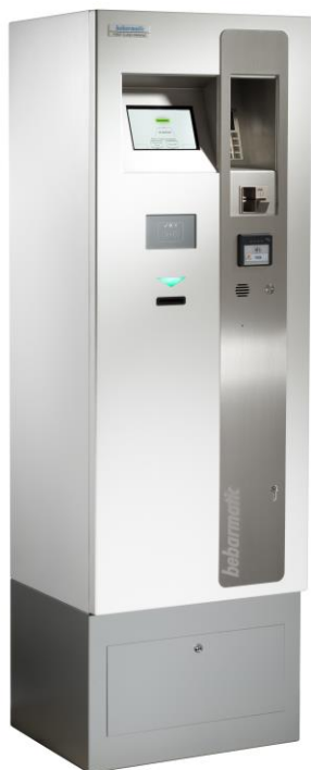
Vorderansicht Kasse Front view cashier